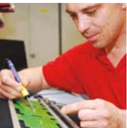
Erfahrung aus Generationen und die Liebe zur Präzision sind ein Garant für Ihre ganz persönliche Sicherheit